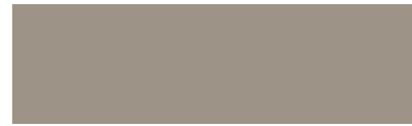
LADY PURE COLOR 11130 SHADE +□