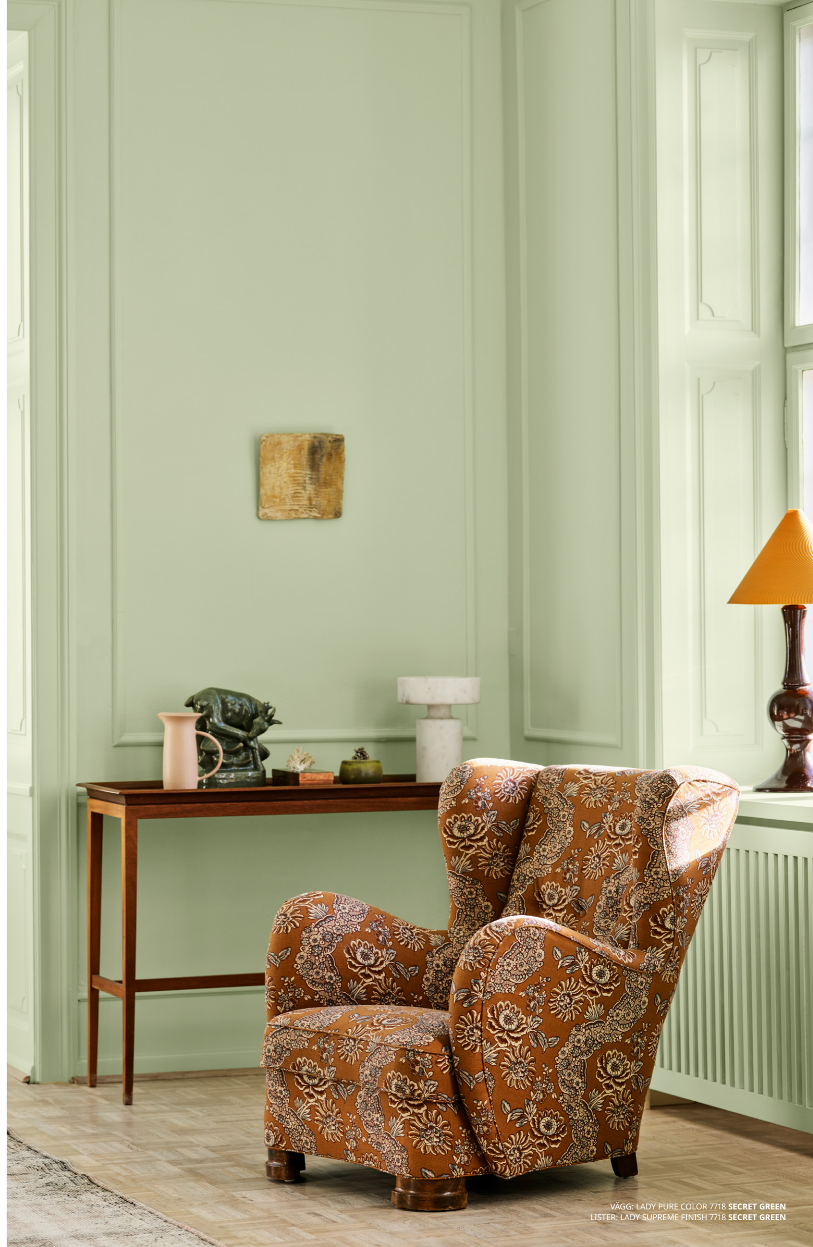
VÄGG: LADY PURE COLOR 7718 SECRET GREEN LISTER: LADY SUPREME FINISH 7718 SECRET GREEN

I det ögonblick du kliver in i ett rum, kommer mötet med omgivningarna att definiera din upplevelse av rummet. Dämpade neutraler och ljusa, naturliga gröntoner upplevs både uppfriskande och lugnande. Samtidigt ger de utrymme för lekfullhet, djärva accentfärger och unika inredningsdetaljer. Bakgrunden sätter takten, förgrunden bär tonen.