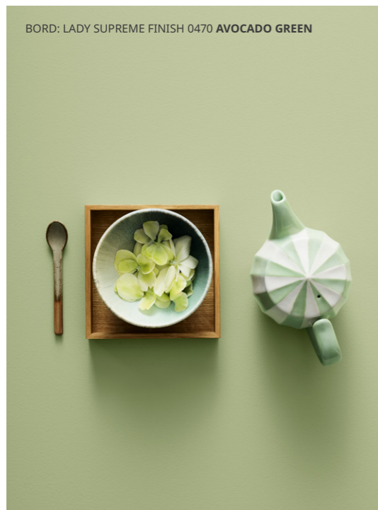
BORD: LADY SUPREME FINISH 0470 AVOCADO GREEN