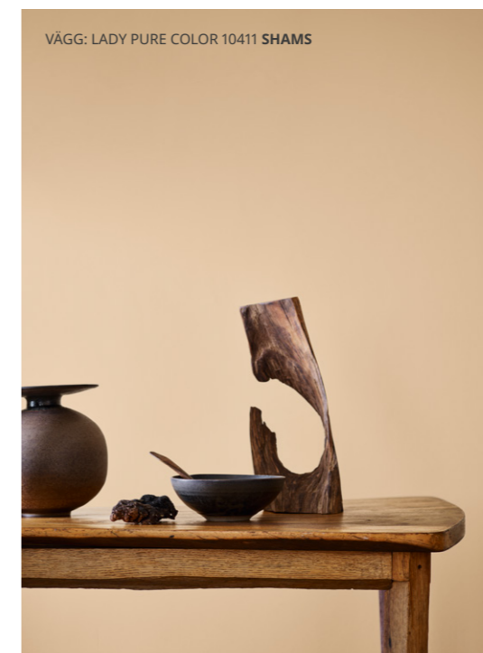
VÄGG: LADY PURE COLOR 10411 SHAMS

Rustika rosatoner, persika, korall och terrakotta kan fylla hemmet med en känsla av jordnära stabilitet – genomtänkt, elegant och opretentiös.