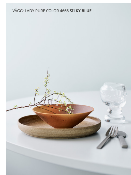
VÄGG: LADY PURE COLOR 4666 SILKY BLUE