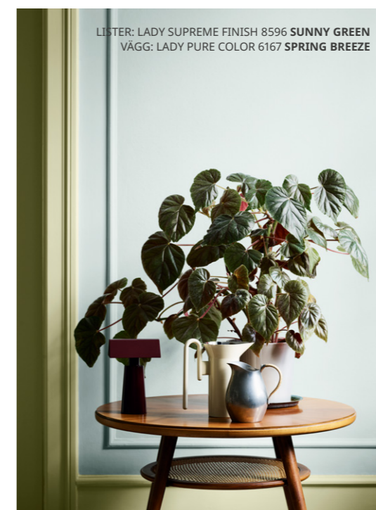
LISTER: LADY SUPREME FINISH 8596 SUNNY GREEN VÄGG: LADY PURE COLOR 6167 SPRING BREEZE