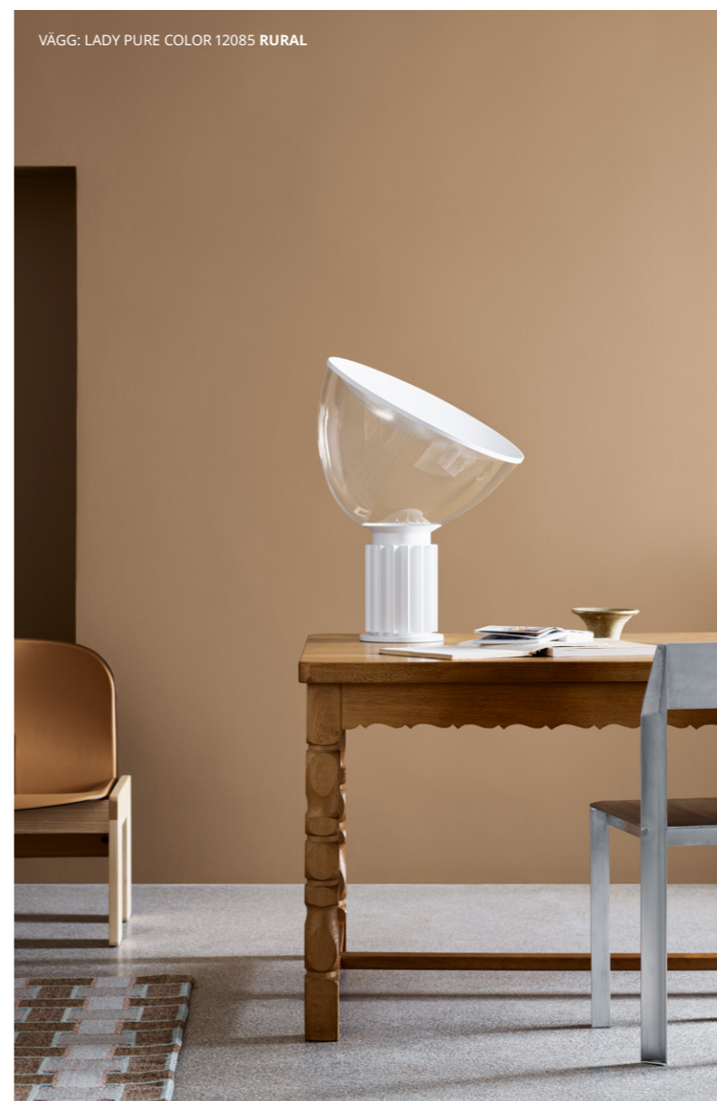
VÄGG: LADY PURE COLOR 12085 RURAL

Se filmen om hur Agathe Berjaut skapade väggkonsten.