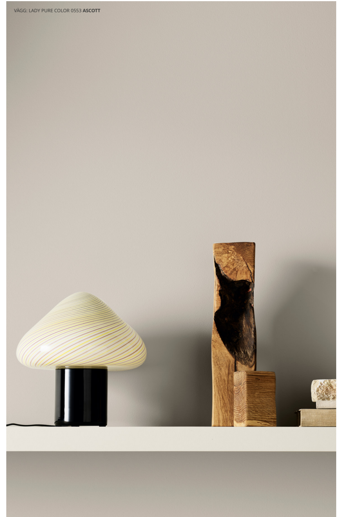
VÄGG: LADY PURE COLOR 0553 ASCOTT

De vackra nyanserna i livet. På samma sätt som vardagen betonar de stora händelserna i livet, kan väggfärgerna i hemmet ge en ny ram till inredning och detaljer. Möbler, konst och design sätter tonen i hemmet, men det är kulörerna och finishen som definierar känslan.