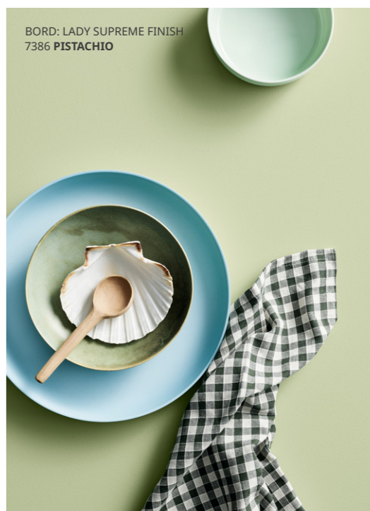
BORD: LADY SUPREME FINISH 7386 PISTACHIO

Från matlagning i köket till stunden vid matbordet – vardagens ögonblick bär på en inneboende poesi om vi lyckas vara närvarande. Välvalda kulörer ger en bra inramning för att lyfta fram även de minsta tillfällena.