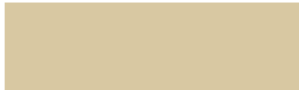
LADY PURE COLOR 11228 FOREST LIGHT +□⊙