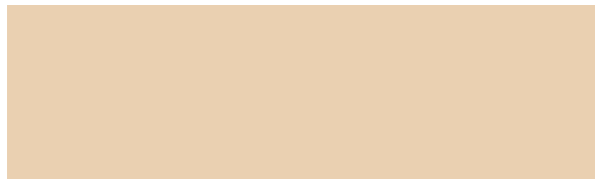
LADY PURE COLOR 1117 PEACH SKY