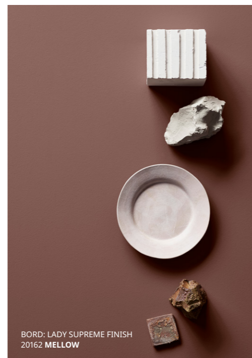
BORD: LADY SUPREME FINISH 20162 MELLOW

Beiga nyanser skapar ett rum med värme och mjukhet, perfekt i sovrum eller andra rum avsedda för komfort och avkoppling.