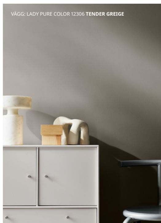
VÄGG: LADY PURE COLOR 12306 TENDER GREIGE