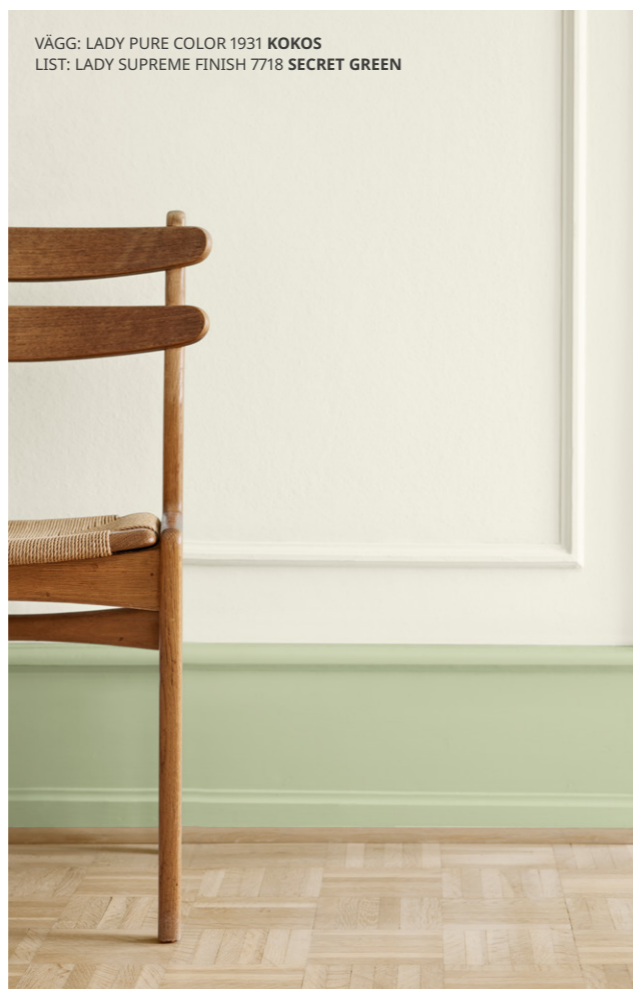
VÄGG: LADY PURE COLOR 1931 KOKOS LIST: LADY SUPREME FINISH 7718 SECRET GREEN

I det ögonblick du kliver in i ett rum, kommer mötet med omgivningarna att definiera din upplevelse av rummet. Dämpade neutraler och ljusa, naturliga gröntoner upplevs både uppfriskande och lugnande. Samtidigt ger de utrymme för lekfullhet, djärva accentfärger och unika inredningsdetaljer. Bakgrunden sätter takten, förgrunden bär tonen.