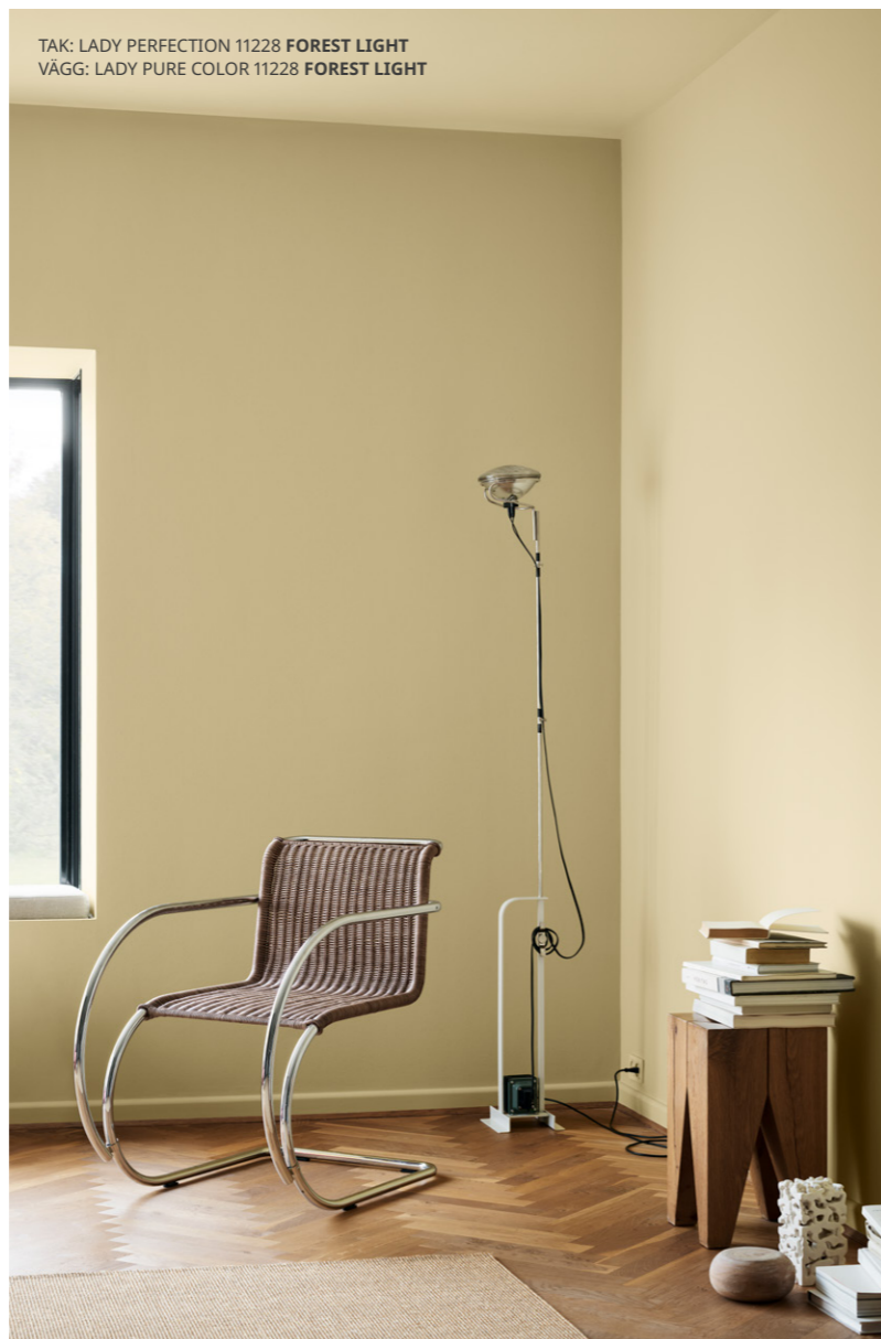
TAK: LADY PERFECTION 11228 FOREST LIGHT VÄGG: LADY PURE COLOR 11228 FOREST LIGHT

Lager på lager. Som en ton spelad i en annan oktav, kan en enkel kulör skapa ett oändligt stort möjlighetsutrymme när den används i olika grader av intensitet.