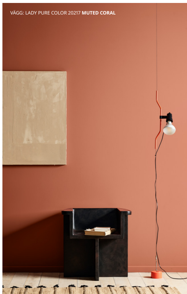
VÄGG: LADY PURE COLOR 20217 MUTED CORAL