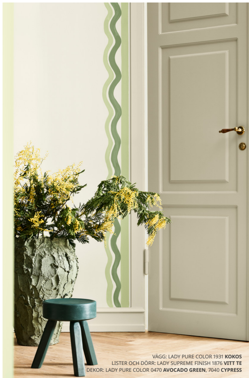
VÄGG: LADY PURE COLOR 1931 KOKOS LISTER OCH DÖRR: LADY SUPREME FINISH 1876 VITT TE DEKOR: LADY PURE COLOR 0470 AVOCADO GREEN, 7040 CYPRESS