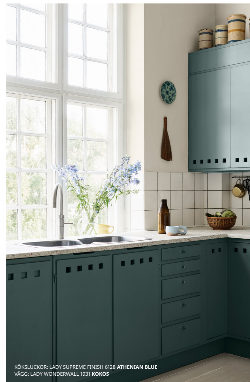
KÖKSLUCKOR: LADY SUPREME FINISH 6128 ATHENIAN BLUE VÄGG: LADY WONDERWALL 1931 KOKOS